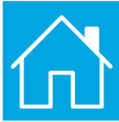
Hilfe bei Wohnungssuche