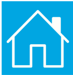
Hilfe bei Wohnungssuche