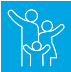
Vereinbarkeit von Familie und Beruf