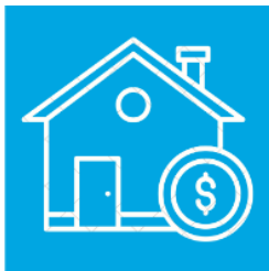
Wirtschaftlich gesunder Betrieb