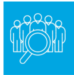
Mitarbeiter werben Mitarbeiter