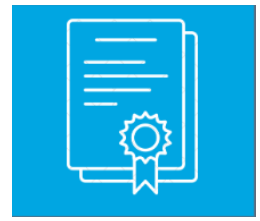
Tarifvertrag öff. Dienst