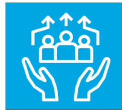
Mitarbeiter werben Mitarbeiter