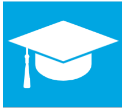
Fort- und Weiterbildung