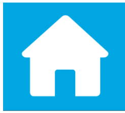
Hilfe bei Wohnungssuche