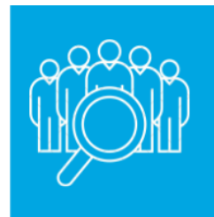
Mitarbeiter werben Mitarbeiter