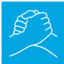
Stabiles Team aus Fach- und Assistenzärzten