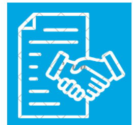
Gehalt nach TV-Ärzte VKA und betriebliche Altersvorsorge