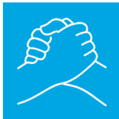
Stabiles Team aus Fach- und Assistenzärzten