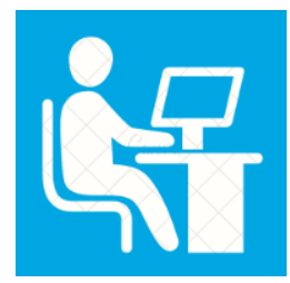
Kurze Wege in der Organisation