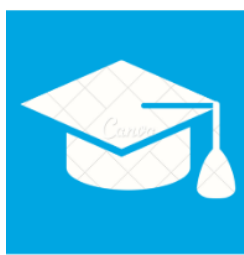
Förderung von Fort- und Weiterbildung