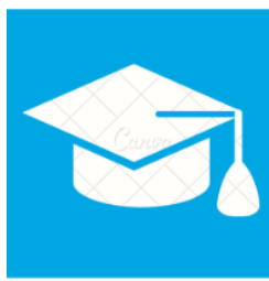
Förderung von Fort- und Weiterbildung