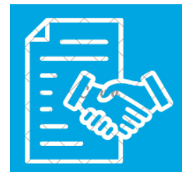
Gehalt nach TV-Ärzte VKA und betriebliche Altersvorsorge