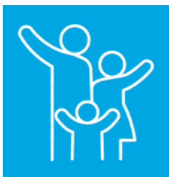
Vereinbarkeit von Familie und Beruf